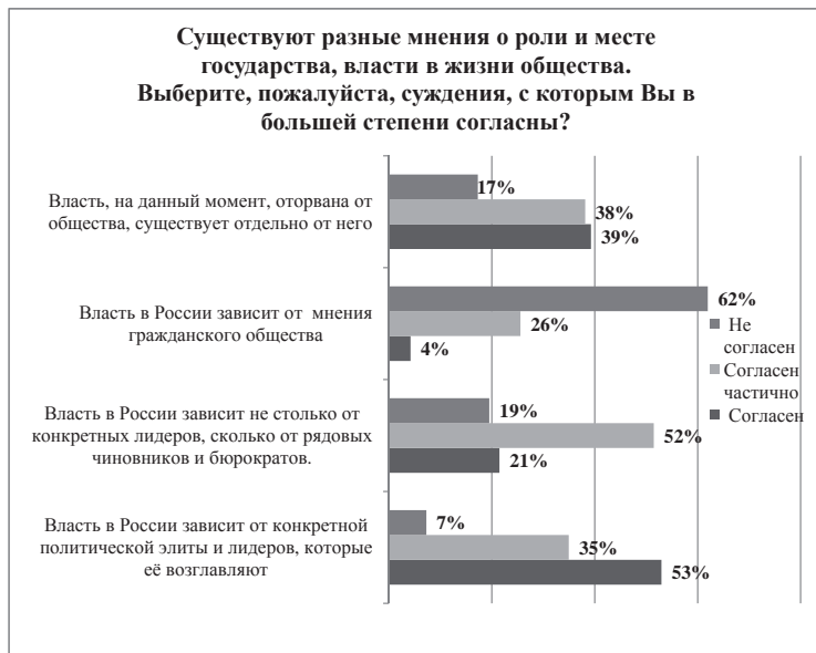
Рис. 4. Распределение ответов респондентов на вопрос «Существуют разные мнения о роли и месте государства, власти в жизни общества. Выберите суждения, с которым Вы в большей степени согласны?» (2009 г.)

ческий базис для тех, кто еще остается в границах государственно-патерналистской системы ценностей и тех, кто осваивает новые демократические и прагматические ценностные ориентиры.