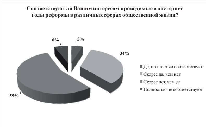
Рис. 2. Распределение ответов респондентов на вопрос «Соответствуют ли вашим интересам, проводимые в последние годы реформы в различных сферах общественной жизни?» (2009 г.)

дентов (6 %) признались, что проводимые реформы «полностью не соответствуют» их интересам. При этом 5 % опрошенных считают, что современные реформы полностью соответствуют их интересам и 34 % выразили свое мнение ответом – «скорее да, чем нет».