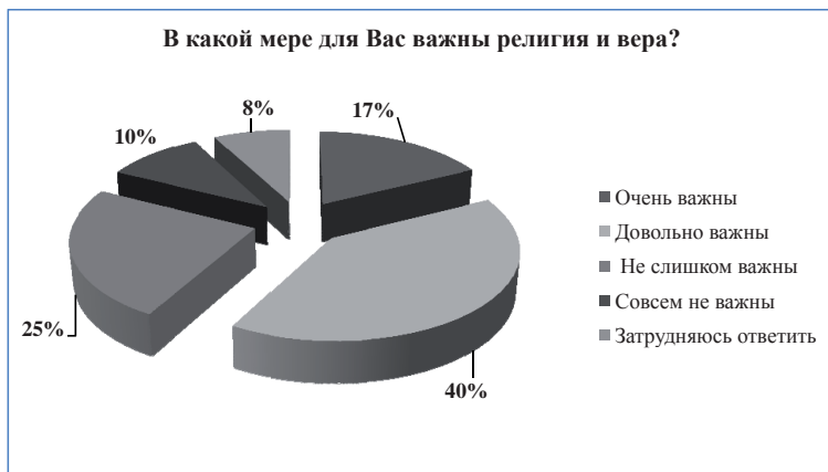
Рис. 1. Распределение ответов респондентов на вопрос: «В какой мере для Вас важны религия и вера?» (2009 г.)

спондентов назвали православие своей верой. Меньшая часть участников опроса заявили о своей симпатии к католицизму (17 %) и христианству вообще (37 %). Наряду с православием анализ данных выявил значительную долю респондентов, испытывающих симпатию к буддизму – 23 %, а также мусульманству – 10 %. Многие респонденты, согласно исследованию, выразили положительное отношение к традициям шаманизма – 18 %, к древнерусскому язычеству – 17 % и эзотерическим учениям – 13 %.